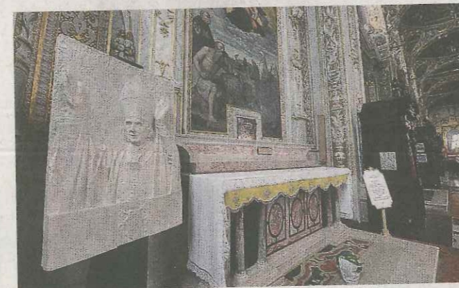
Devozione. L'altare di san Girolamo ospita la reliquia di Paolo VI

cialmente la data della cerimonia in Vaticano durante la quale papa Montini verrà proclamato santo, quasi certamente sarà il 21 o il 28 ottobre. Non solo, proprio alle Grazie, nell'altare di san Girolamo è conservata la reliquia della beatificazione di Paolo VI, ovvero la maglietta che indossava durante l'attentato di Manila nel 1970. Davanti a quell'altare ha pregato mamma Vanna per chiedere che la sua piccola Amanda, ancora in grembo, potesse nascere nonostante la rottura delle acque quando aveva solo 13 settimane e 3 giorni: la Chiesa ha riconosciuto l'intercessione di papa Montini e ha definito miracolosa la nascita della piccola veronese avvenuta il 25 dicembre del 2014.