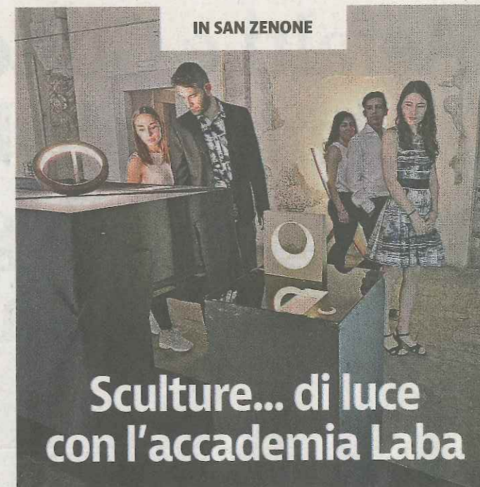
IN SAN ZENONE

Tutte le iniziative in programma per «Settimana di cammino sulle orme di papa Paolo VI» sono aperte alla cittadinanza, che può scegliere a quale percorso prendere parte o accedere solo a sezioni dello stesso, tenendo conto delle difficoltà del percorso e della distanza fra le tappe. Bisogna però iscriversi e segnalare la propria presenza. Informazioni e prenotazioni: 3331820250. //