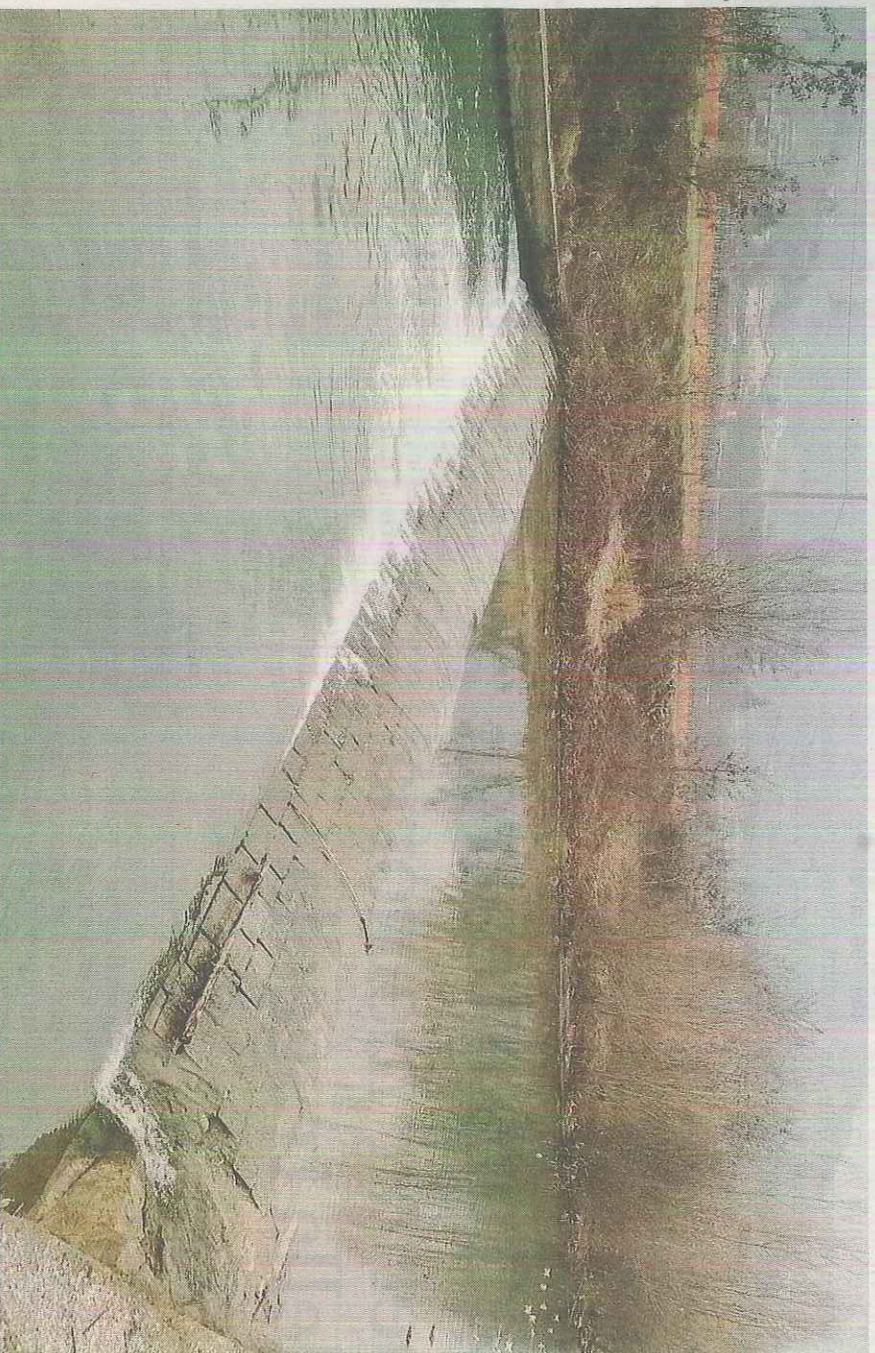
Emergenza. Acque schiumose a Cailina, emergenza risalente alla fine del 2015 e all'inizio dell'anno in corso