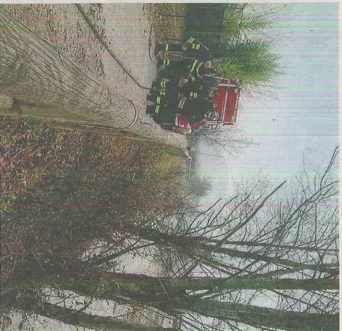
Rogo. Vigili del fuoco in azione lungo la ciclabile

Il rogo. «Probabilmente qualcuno ha appiccato il fuoco per sbarazzarsi di alcune ramaglie - continua l'assessore -. Sono problemi che vanno affrontati uno alla volta. Fortunatamente a breve dovrebbero concludersi i lavori di manutenzione dell'alveo del fiume da parte dell'Agenda Interregionale per il fiume Po. Sono stati anche riparati lo steccato e le parchine lungo la pista ciclabile che erano stati inavvertitamente rotti durante i lavori per rinnovare la vegetazione che ostruiva il corso del fiume. Per quanto riguarda la situazione generale del Mella - conclude Rizzinelli -, il Comune ha chiesto l'estensione dei controlli dell'Osservatorio Acqua Bene Comune di Brescia, ma stiamo ancora aspettando notizie. Nel frattempo noi continueremo a vigilare, anche grazie al grande aiuto dei cittadini volontari delle Gey, che presidiano il territorio, in particolare negli orari non coperti dai vigili, e che hanno già fermato alcune persone colte in comportamenti irrispettosi dell'ambiente». //