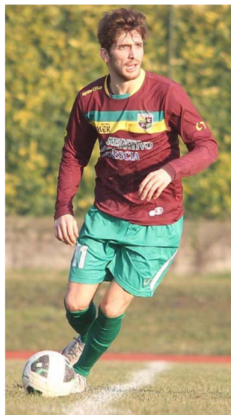
Un confronto tra Bidani del Nave e Palmiri del Concesio|Turra, autore del gol del provvisorio pari del Navecortine.