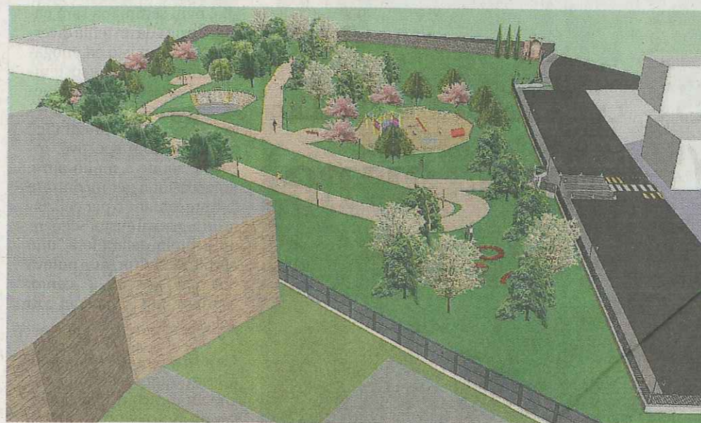
Elaborazione grafica. La pista, armonizzata con la naturale pendenza del terreno, sarà lunga 215 metri