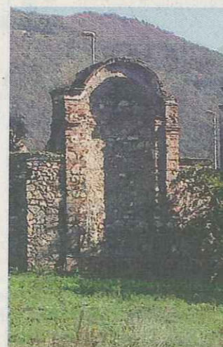
Storia. L'antica nicchia monumentale

cesio». Il progetto prevede anche la realizzazione del parco giochi, un'area attrezzata per i più piccini, «per la quale - conclude Belleri - il Comune purtroppo non ha i fondi. Ci rivolgiamo per questo ai privati e chiediamo che si faccia avanti chiunque voglia contribuire a regalare ai bimbi un parco giochi». //