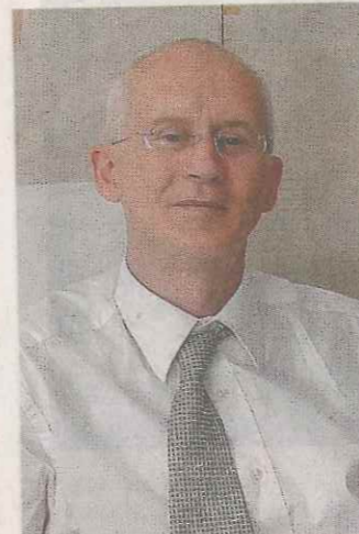
Al comando. Il sindaco Retali

«Abbiamo deciso di aderire a questo accordo - continua Belleri - per portare avanti il nostro programma di riqualificazione delle scuole. Abbiamo presentato un progetto e ottenuto il contributo». Conclusi i lavori nella palestra di San Vigilio, si attendono gli ultimi ritocchi in quella di Sant'Andrea. «Nel mese di ottobre - assicurano sindaco e assessore - saranno inaugurate entrambe». //