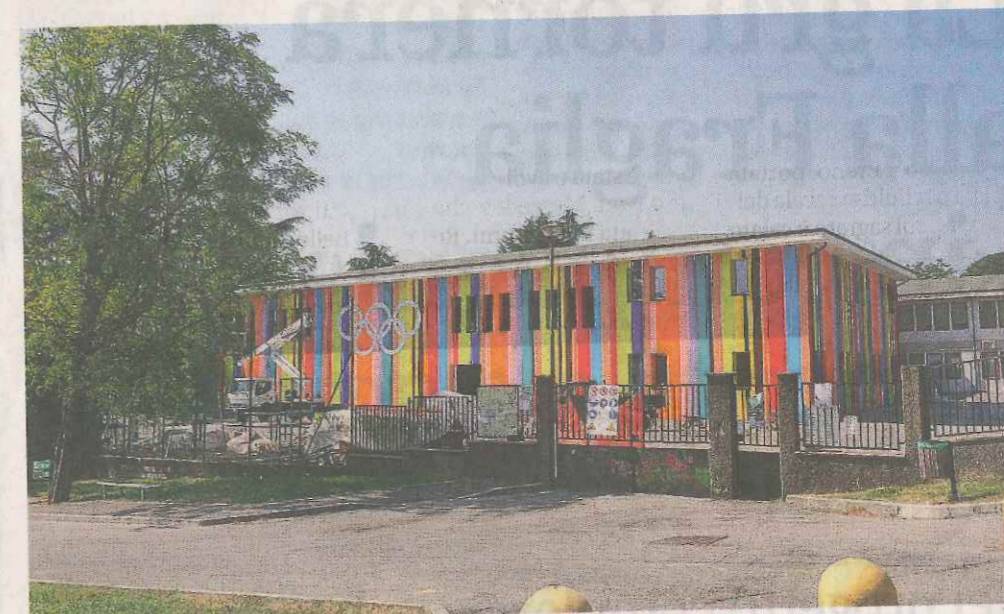
Cerchi e strisce. La coloratissima facciata della nuova palestra di S. Andrea di Concesio