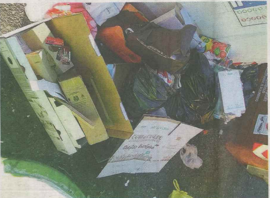
Fuori cassonetto. Spesso i rifiuti vengono abbandonati accanto ai bidoni

Giovedì la riunione per valutare il nuovo metodo, su cui pesa però l'incognita dei costi