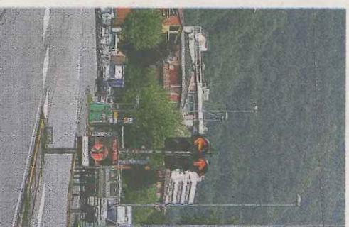
Destinato a sparire. Il semaforo che la rotonda «taglierà»