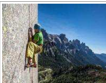
Maurizio Zanolla detto Manolo durante un'arrampicata verticale

Tutti i posti esauriti giovedì sera al Teatro di Inzino di Gardone per la prima serata di « Altire Festival 2017 » in cui è stato presentato il programma completo della rassegna. Con l'ospite scelto per dare il via alle danze non poteva andare diversamente: Maurizio Zanolla detto Manolo, soprannominato il «Mago del Verticale» che nonostante i quasi sessant'anni è ancora uno dei più importanti punti di riferimento degli arrampicatori; anche dei giovanissimi che infatti erano numerosissimi in sala e ne commentavano ad alta voce le immagini delle sue performance arrampicatorie. CON FOTOGRAFIE e filmati e rispondendo alle domande spesso incalzanti di Mauro Baglioni, presidente del Club alpino di Gardone che lo intervistava, Manolo ha saputo ancora una volta affascinare l'intera platea che interrompeva spesso la proiezione