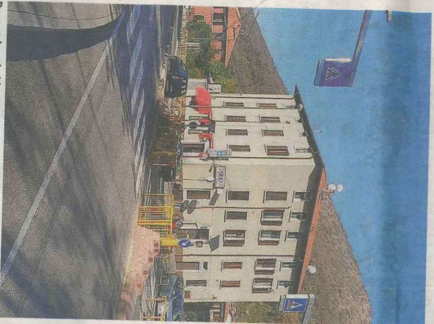
Passaggio a rischio. Qui verrà installato un semaforo pedonale

In questo modo verrà risolta una situazione di pericolo che dura da parecchi anni