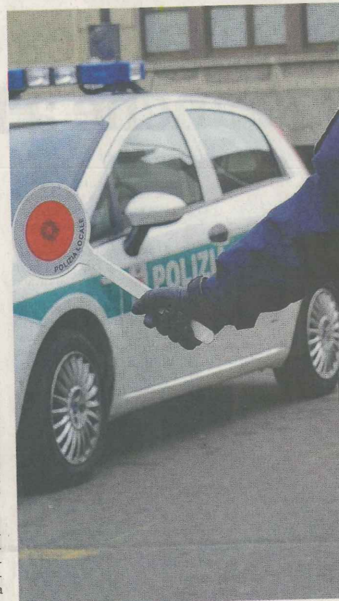
Altolà. Fermata la procedura per la fusione

Campo inesplorato. Il progetto era ispirato a quanto da qualche anno avviene con le Unioni dei Comuni sotto i cinquemila abitanti (obbligati dalla legge ad accorpate alcuni servizi), ma dal quale è sostanzial-