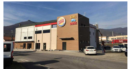
L'ex cinema recuperato e trasformato in fast food: il Burger King è aperto già da qualche giorno