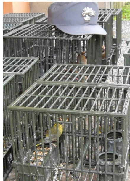
I lucherini trovati a Concesio

IDENTIFICATA la proprietà di edificio e area, i militari sono risaliti alla residenza principale del capannista-uccellatore e l'hanno raggiunta effettuando una perquisizione. Più che positiva: il cinquantenne custodiva immagazzinate altre sei reti e un notevole numero di mini trappole, i «sep», e mentre in una voliera c'erano i richiami vivi consentiti dalla sua attività di migratorista, nascosti in un armadio nel garage c'erano tre lucherini, nove fringuelli e tre frosoni, tutti protetti e catturati recentemente dalle reti dal bracconiere, tanto che è stato possibile liberarli direttamente sul posto. terminate le verifiche, il valtrumplino è stato denunciato per caccia con mezzi vietati e detenzione di specie particolarmente protette.