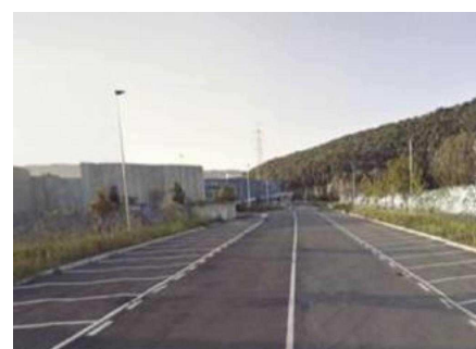
La zona di accesso e i parcheggi