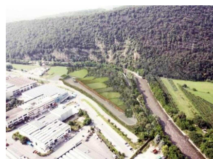
In una simulazione grafica l'area che ospiterà il cantiere e il futuro depuratore della Valtrompia