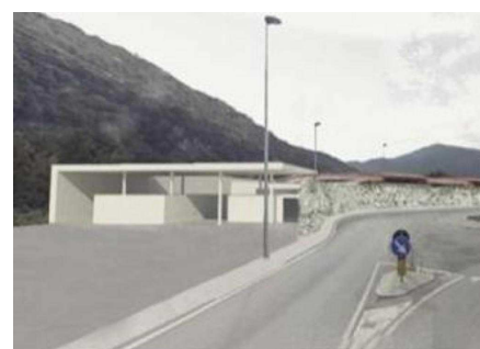
Il depuratore visto dal basso